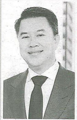
>>> อาทิตย์ นันทวิทยา

ปีนี้ สดใสๆ ชัวร์ แน่หนอน... ได้ยินแล้วชื่นใจ ไร่ กังวลกันได้แล้วคร้า ❖❖ ดีไม่มีตก!! บมจ. เดนทัล คอร์ปอเรชั่น หรือ (D) ผู้ให้บริการทันตกรรมชั้นนำของไทย เปิดสาขาใหม่ที่ไทเท ก็ได้รับกระแสตอบรับที่ดีไม่มีหยุด ล่าสุด...สาขาใหม่ในห้างสรรพสินค้าขนาดใหญ่ ใจกลางย่านสุขุมวิท ศูนย์ทันตกรรม Dental Signature EmQuartier ชั้น 4 ตึก A ห้อง 4A11 ก็ไม่ทำให้ผิดหวัง ใครอยากฟันดี...ฟันสวยให้ไว้ตั้งแต่วันนี้ - 31 ก.ค. เท่านั้น ❖❖ วากกลับมาที่สายการเงินกันบ้าง ล่าสุด “อาทิตย์ นันทวิทยา” นายใหญ่แห่ง ธนาคารไทยพาณิชย์ หรือ SCB ออกมาโชว์ตัวเลขไตรมาส 2 กับกำไรสวยๆ ที่ 11,911 ล้านบาท! ขอแะ