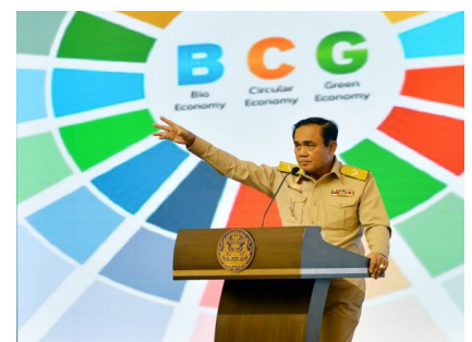
ถกพรรคหลังพรรคฯ เลือกตั้ง