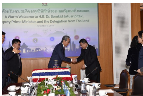
'สมคิด' ถลก้อมจีนลงทุนไทย