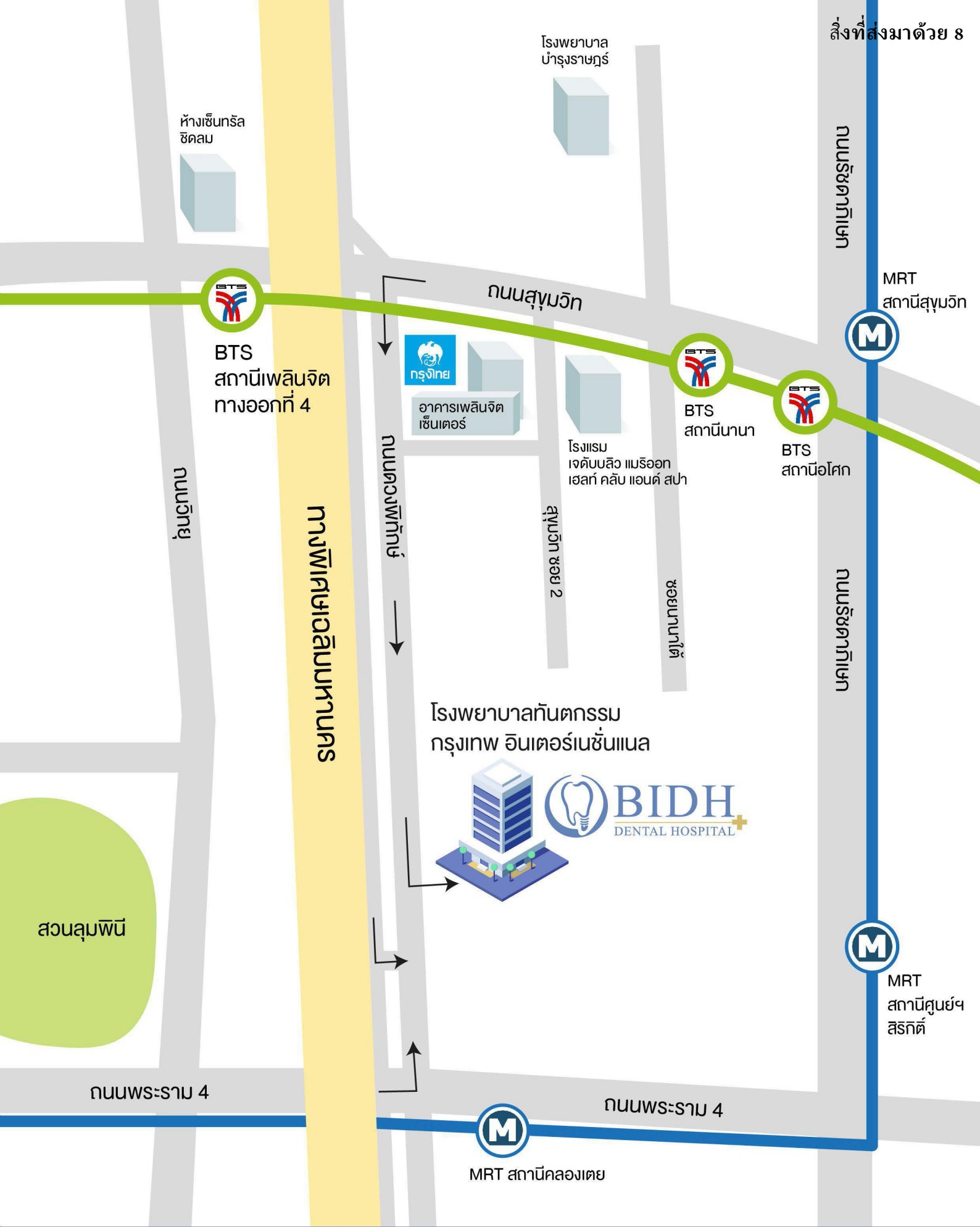
Bangkok International Dental Hospital (BIDH) โรงพยาบาลทันตกรรมกรุงเทพ อินเตอร์เนชั่นแนล